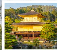
คิงคะคุจิ