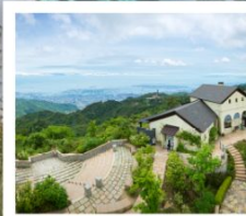
สทโกะ การ์เด็น เทอร์เรซ