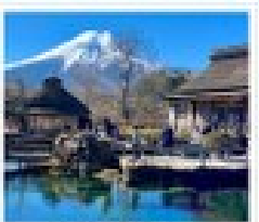
โอชิโนะ ฮัทโท