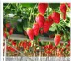
สวนผลไม้ฮามาบิตสึ