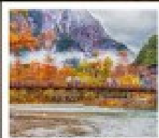
คามิโกจิ

ลิ้มรสเมนูสุดพิเศษ บุฟเฟ่ต์ซาซิมิอื่น ๆ / ซาซิมิพรีเมียม