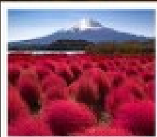
โอดิชิ ฟูจิ