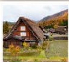
ริซากาวาโกะ