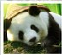
ดูแม่กบิเบตเต้า

อุทยานหวงหลง / อุทยานจิวจ้ายโกว / โรว์ฟิเบตดูแม่กบิเบตเต้าเพนต้าดูเจียงเซี่ย / สวนดอกไม้ที่กูว / ระเบียบเก้ว / ถนนถนนเดินสูบซีง / ถนนโบราณจีนหนี่