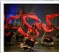
โรว์ฟิเบต