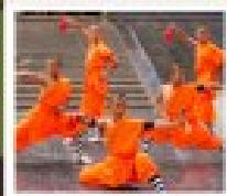
โชว์ราชวงศ์ถัง

PERIOD 1 : 9 - 14 สิงหาคม | PERIOD 2 : 18 - 23 ตุลาคม 2567