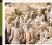
สุสานม้าคำ

วัดสำคัญ / ป่าเจดีย์ / โรงละครแสดงวิทยายุทธสำคัญ / อุทยานหมุนโถฮาน ศาลเจ้าทวนอู / กำแพงหลงเหมิน / สวนอาหารจีนซี / ถนนคนเดินวัฒนธรรมต้าถิง โชว์ราชวงศ์ถัง / กำแพงเมืองโบราณซีอาน / วัดสาม / ตลาดมุสลิม