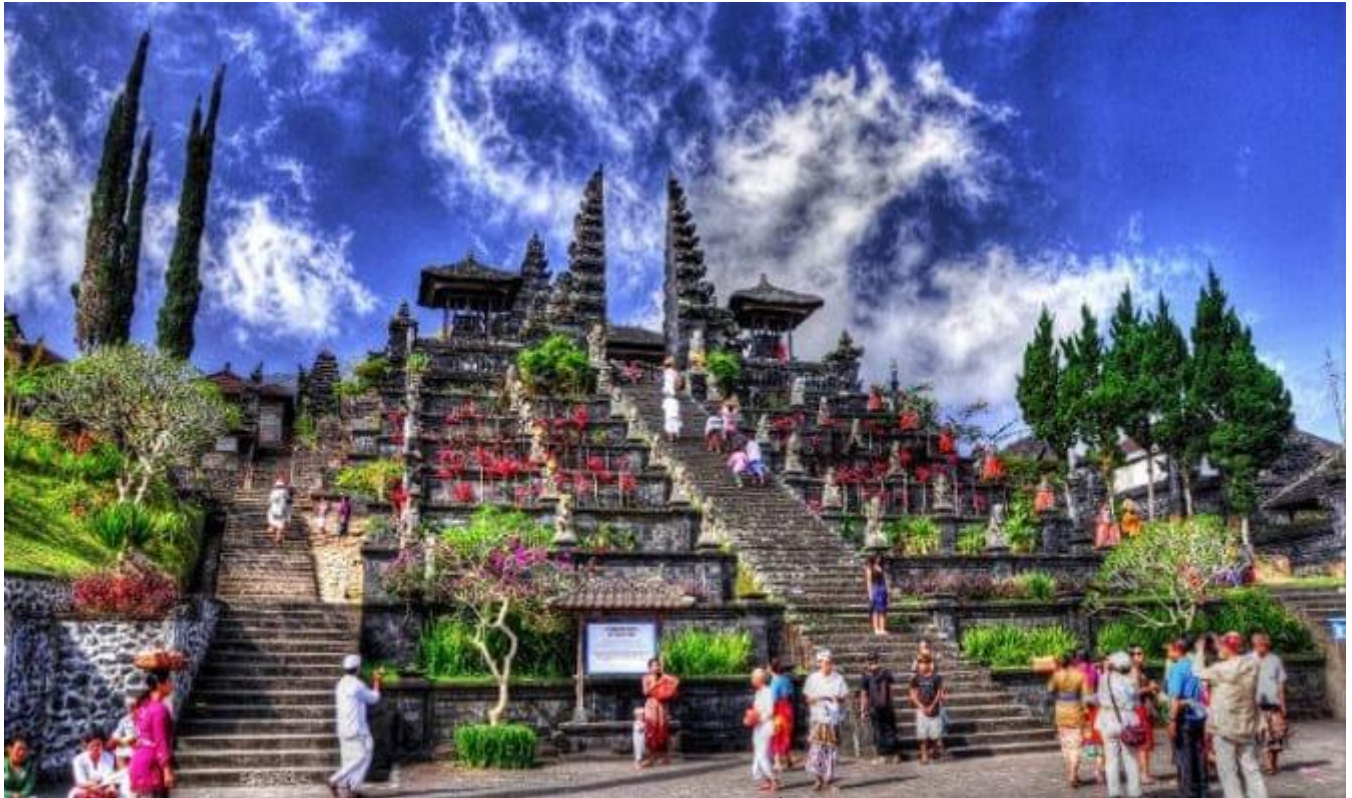
**** หากมีการแจ้งเดือนภัยภูเขาไฟ ขอสงวนสิทธิ์ในการปรับเปลี่ยนวัดบาตัวร์แทน ****