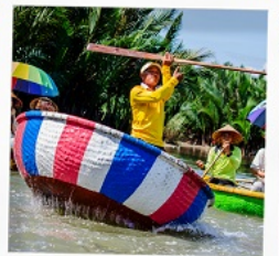
เรือกระดัง