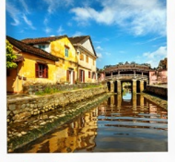
เมืองโบราณฮอยอัน