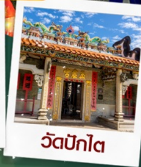
วัดปึกไต่