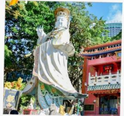
เจ้าแม่กวนอิมรพัสลาลัย

23 กุมภาพันธ์ 2568 วันเยี่ยมเงินเจ้าแม่กวนอิม วัดฮ่องฮำ