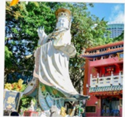
เจ้าแม่กวนอิมรพัสลเบย์

23 กุมภาพันธ์ 2568 วันยืมเงินเจ้าแม่กวนอิม วัดสองอำ