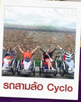
รถสามล้อ Cyclo