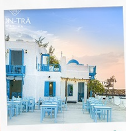
ซานตารีนาคาเฟ่