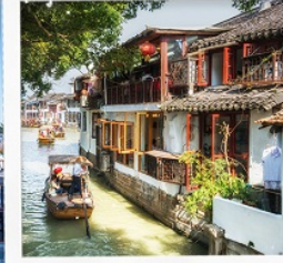
เมืองโบราณจูเจียเจี๋ย