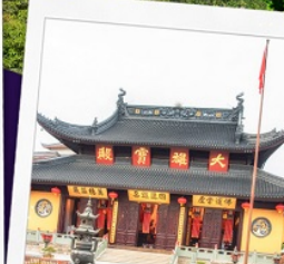
วัดพระหยก