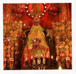
เจ้าแม่กวนอิมวัดสองอ่า