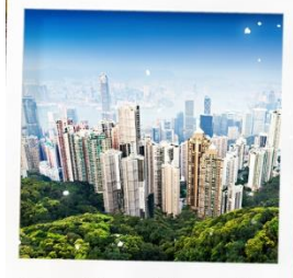
จุดชมวิวเขาวิกตอเรีย