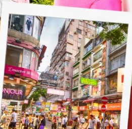
ช้อปปิ้งย่านมงก๊ก