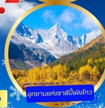
อุทยานแห่งชาติปี้เฟิงโกว