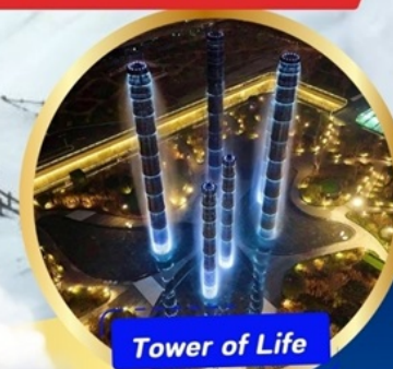
Tower of Life