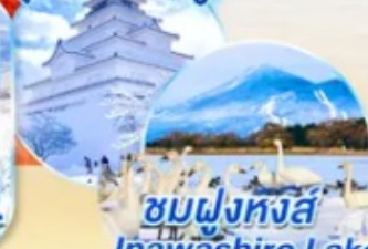
ชมฝูงหงส์ Inawashiro Lake