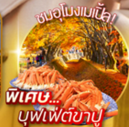
พิเศษ... บุฟเฟ่ต์ชาบู

ไฮไลท์!! สะดุดตาไปกับ ไบโม่เปลี่ยนสี ณ อุโมงค์เมเปิ้ล หรือ โม่มิจิ (ขึ้นอยู่กับฤดูกาล) เสาโทริอิสีแดง ริมทะเลสาบที่เป็นจุดถ่ายรูปยอดนิยม ณ ศาลเจ้าฮาโกเนะ นั่งกระเช้า คาชิ คาชิ ชมความสวยงามของทะเลสาบควากูจิโกะจากมุมสูง หมู่บ้านโอชิโนะ-ฮักโก วิวกุเอาไฟฟูจิสีขาวตัดกับพื้นหลังสีฟ้า เป็นภาพที่สวยงามมาก