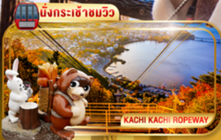
KACHI KACHI ROPEWAY