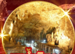
ชมถ้ำหินงอก ( Gyokusendo Cave )

ไฮไลท์!! ชม ผามินซาโมะ ลักษณะคล้ายวงช้างหันหน้าสู่ทะเลจีน พิพิธภัณฑสถานสัตว์น้ำซูราอุมิ พิพิธภัณฑสถานสัตว์น้ำที่ติดอันดับ 1 ใน 3 ญี่ปุ่น ชม ปราสาทซูริ (ด้านนอก) ปราสาทตามแบบสถาปัตยกรรมของชาวริวกิว ขอพรเกี่ยวกับธุรกิจการทำงานให้เจริญรุ่งเรือง ร่ำรวย ศาลเจ้าบะมีโมะอุเอะ