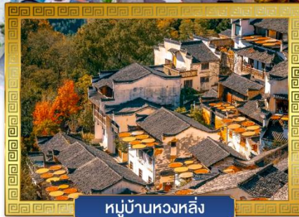
หมู่บ้านหวงหลิ่ง