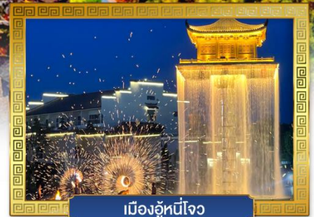
เมืองอุ๋หนี่โจว