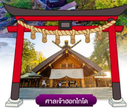
ศาลเจ้าฮอกไกโด