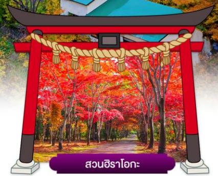
สวนฮิราโอกะ