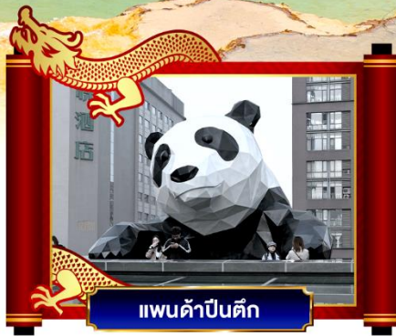
แพนด้าป็นตึก