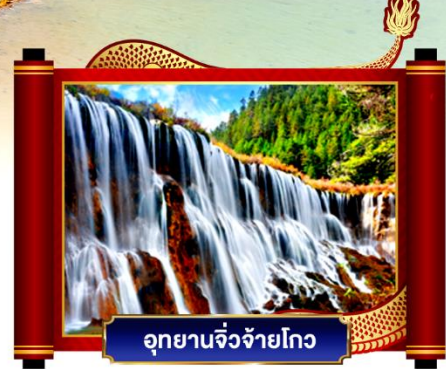
อุทยานจิวจ้ายโกว