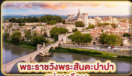
พระราชวังพระสันตะปาปา แห่งอเวัญ