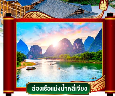
ล่องเรือแม่น้ำหลีเจียง