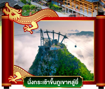
นั่งกระเช้าขึ้นภูเขาหลูอี้