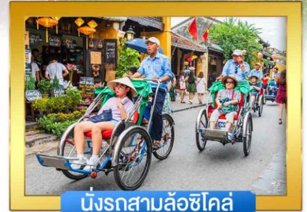
นั่งรถสามล้อชิโคล์