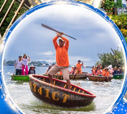
นั่งเรือกระดัง Hoi an