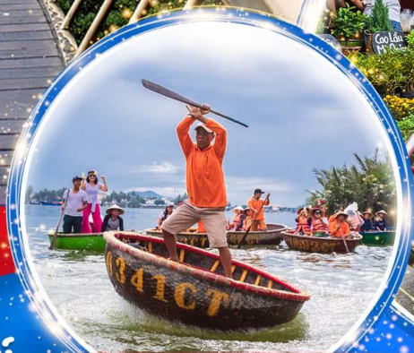
นั่งเรือกระดัง Hoi an