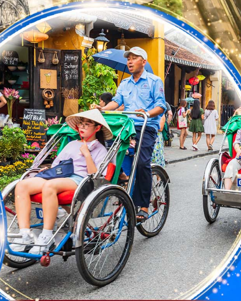
นั่งรถสามล้อซิโคล