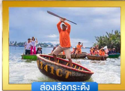
ล่องเรือกระดัง