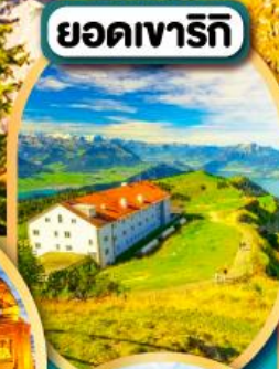
ยอดเขารีกิ