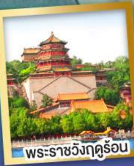
พระราชวังฤดูร้อน