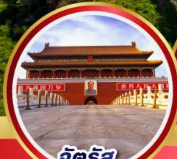
จัตุรัส เทียนอันเหมิน