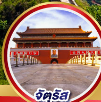
จัตุรัส เทียนอันเหมิน