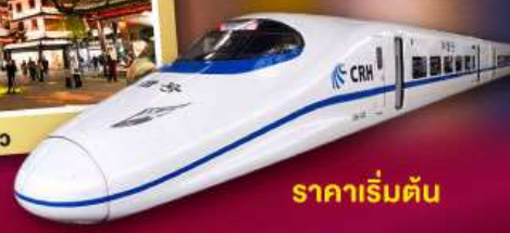
ราคาเริ่มต้น