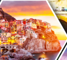
หมู่บ้านมาราโรลา