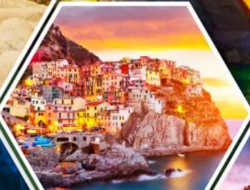
หมู่บ้านมาราโรลา