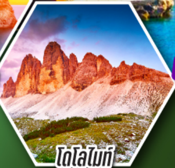
โดโลไมท์

โปรแกรมเดียว เก็บครบจบ อิตาลี ตั้งแต่เหนือถึงใต้