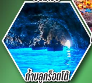
ถ้ำบลูกรอตโต