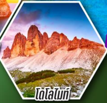
โตโลไมท์