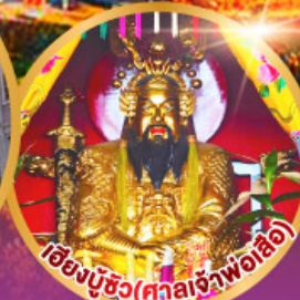
เชียงมูซิว (ศาลเจ้าพ่อเสือ)

เมนูพิเศษ!! อาหารแต่จิว 18 อย่าง ห้ามพลาด! ใต้ต้นตำรับชิวเกา สุกี้ซิว