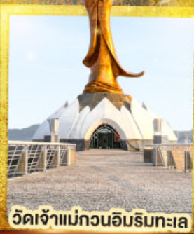
วัดเจ้าแม่กวนอิมริมทะเล