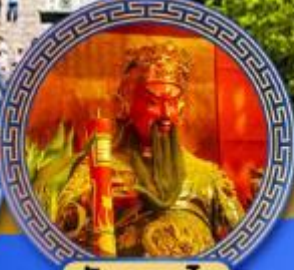
วัดกวนโถ