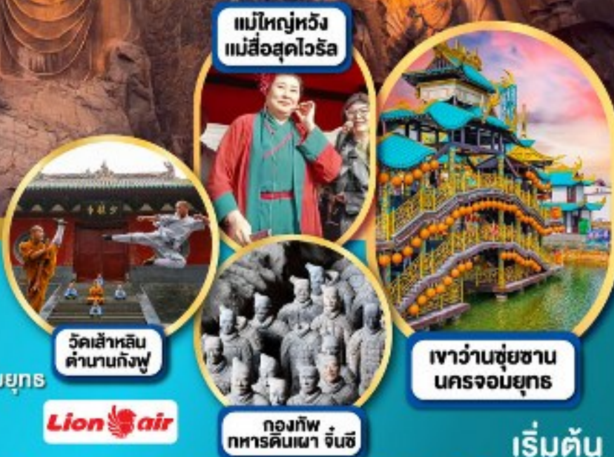
แม่ใหญ่หวัง แม่สื่อสุดไวรัล