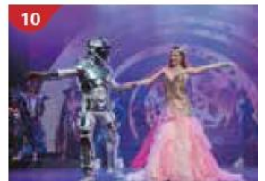
10 Zodiac Theatre Enjoy live production shows from the acclaimed award-winning entertainment team.