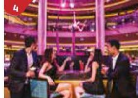
4 Bar 360 Catch live music and aerial acrobatic performances with a glass of champagne.