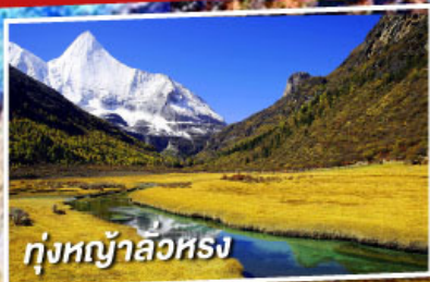
ทุ่งหญ้าลิวหรง