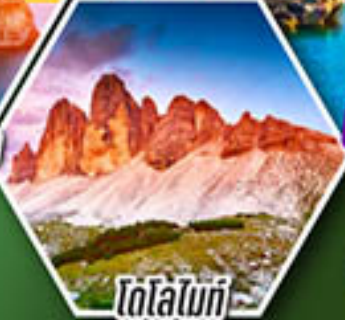
โดโลไมท์

โปรแกรมเดียว เก็บครบจบ อิตาลี ตั้งแต่เหนือถึงใต้