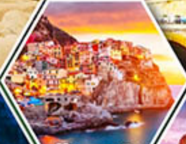
หมู่บ้านมาราโรลา