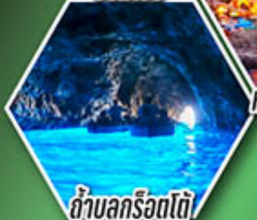
ถ้ำลูกรोटโต้