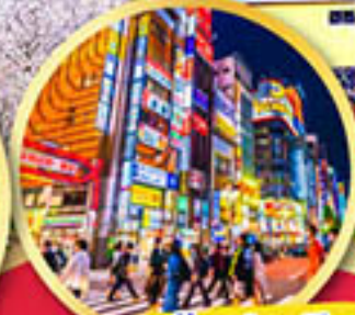
ช้อปปิ้ง ย่านชินจูกุ

พักออนเซ็น 1 คืน , พักโตเกียว 2 คืน บินเข้านาโกย่า-ออกโตเกียว