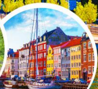
ท่าเรืออ่าววัน.โตเปนฮากน