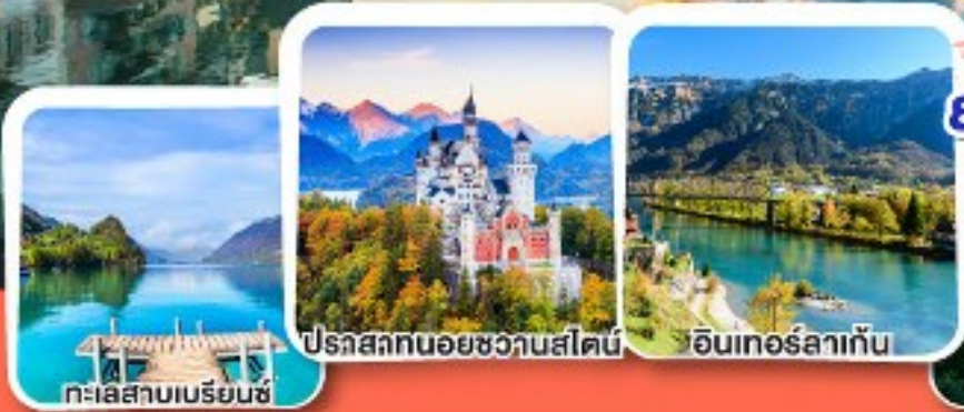
ทะเลสาบเบเรียนซ์

การันตีได้ค้ำคินบน ยอดเขาริ ราชนิแห่งขุนเขาสวิส.