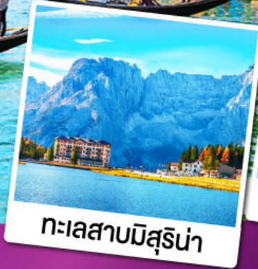
ทะเลสาบมิสุรีน่า