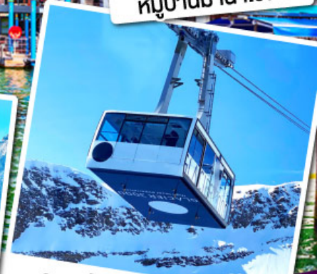
กระเช้ากลาเซียร์ 3000