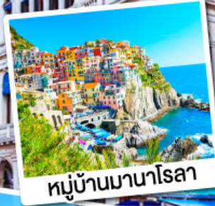
หมู่บ้านมานาโรลา

เที่ยวเก็บครบไฮไลต์โดโลไมท์ ทั้งทะเลสาบมิสุรีน่า