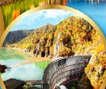
เขื่อนไฮเฮเคียว