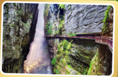
หุบเขารอยแยกอุหลิงซาน