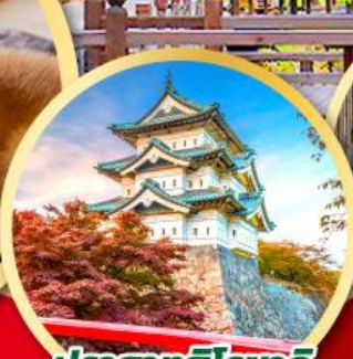
ปราสาทโงโระซากิ