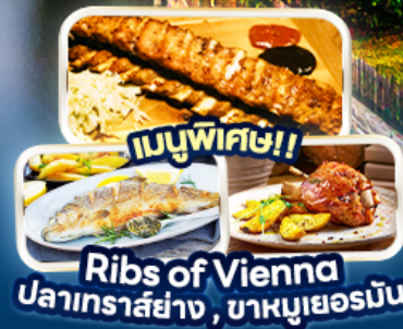
เมนูพิเศษ! Rib's of Vienna ปลาเทราสย่าง, บาหมูเยอรมัน