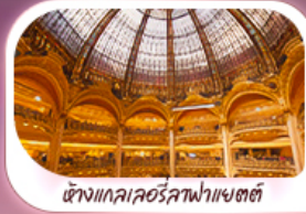
ห้างแลคซัวร์ลาฟาแยตต์