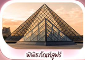
พิพิธภัณฑ์ลูฟร์