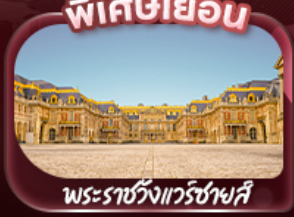
พิเศษเยือน พระราชวังแวร์ซายส์