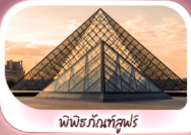
พิพิธภัณฑ์ลูฟวร์