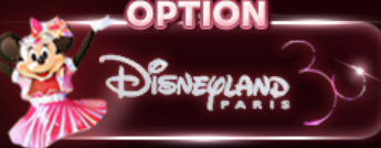
OPTION Disneyland Paris

เดินทาง 16-21 พ.ค.68 / 16-21 มิ.ย.68 22-27 มิ.ย.68 / 1-6 พ.ค.68 22-27 พ.ค.68 / 1-6 มิ.ย.68