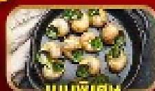
เมนูพิเศษ หอย Escargot