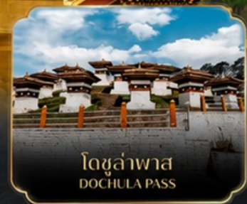
โดจุลาพาส DOCHULA PASS