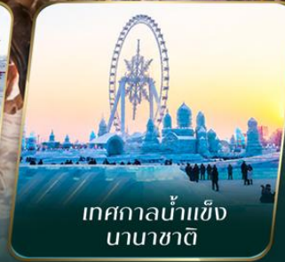
เทศกาลน้ำแข็ง นานาชาติ