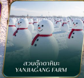
สวนตุ๊กตาหิมะ YANJIAGANG FARM