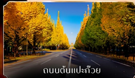
ถนนต้นแปะก๊วย