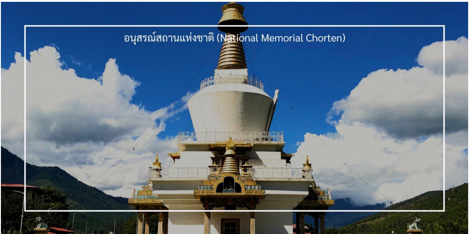
อนุสรณ์สถานแห่งชาติ (National Memorial Chorten)

เที่ยวชม อนุสรณ์สถาน Memorial Chorten หรือที่รู้จักกันในชื่อ Chorten เป็นอนุสรณ์สถานที่สำคัญในเมืองทิมพู (Thimphu) ประเทศภูฏาน สร้างขึ้นเพื่อเป็นเกียรติแก่กษัตริย์ Jigme Dorji Wangchuck ซึ่งเป็นพระมหากษัตริย์องค์ที่สามของภูฏาน มีการออกแบบที่เป็นเอกลักษณ์ในสไตล์ภูฏาน โดยมีโดมกลมใหญ่และลวดลายที่สวยงาม ทำให้เป็นจุดเด่นในทิมพู อนุสรณ์สถานนี้เป็นสถานที่ที่พระสงฆ์และประชาชนมานั่งทำสมาธิและสวดมนต์ โดยมีการหมุน กรงล้อมนตรา (prayer wheel) รอบๆ เพื่อทำให้เกิดความสงบและเสริมสร้างพลังทางจิตใจ สร้างขึ้นในปี 1974 เพื่อเป็นอนุสรณ์แก่กษัตริย์ ผู้ซึ่งมีบทบาทสำคัญในการพัฒนาประเทศและการสร้างสันติภาพในภูฏาน ตั้งอยู่ใกล้กับใจกลางเมืองทิมพู ทำให้สามารถเข้าถึงได้ง่ายและสะดวกสำหรับนักท่องเที่ยว